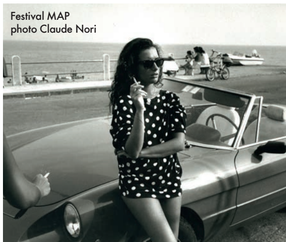
Festival MAP