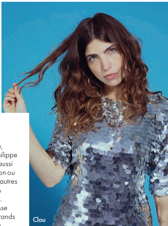
25 JUIN 2021

À partir de 8 € l'entrée. Du 8 au 18 juillet. Pause guitare. Albi. pauseguitare.net