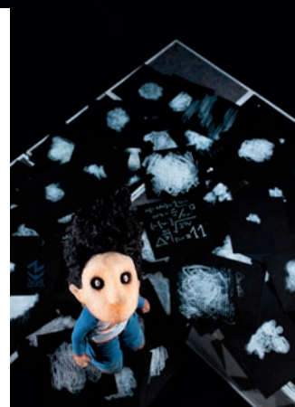
Zusvex, « Le Roi des nuages »

Du 5 au 8 août. Mima. Pays de Mirepoix/Lavelanet. mima.artsdelamarionnette.com