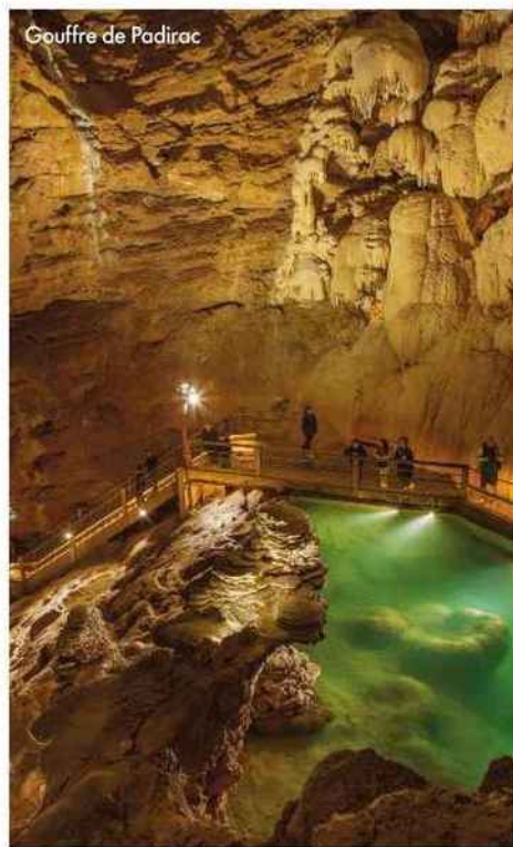
Gouffre de Padirac

Lieu-dit Le Gouffre, Padirac (46). Tél. : 05 65 33 64 56. gouffre-depadirac.com ■