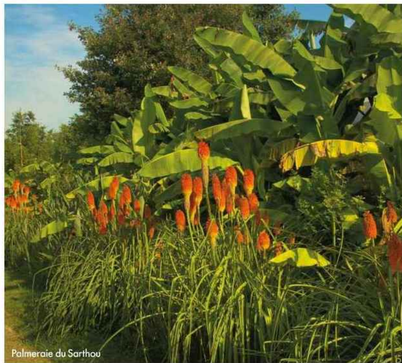
Palmeraie du Sarthou